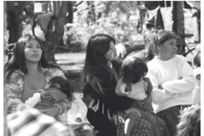
Participantes do 1º Encontro dos Guarani no Paraná

Dois Grupos de Trabalho foram constituídos para realizar estudos de identificação e delimitação de terras Guarani nesta região do estado do Paraná. No entanto, ambos estão paralisados. Um