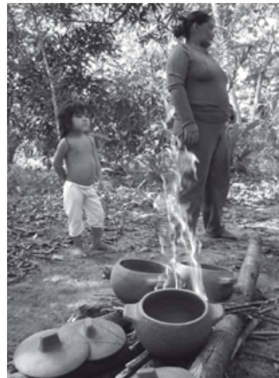
Comunidade Apurinã durante processo de fabricação de cerâmica

Assim, de forma conclusiva, podemos dizer que as histórias que aparentemente apresentam o fracasso ou uma suposta baixa auto-estima não querem afirmar a inferioridade Apurinã em relação aos outros povos, às outras culturas. Quando elas são acionadas, querem justamente dar esperança e afirmar aos ouvintes que o povo Apurinã é um povo eleito e que com cooperação e dedicação para “fazer a coisa certa” eles vão triunfar em seus projetos. Elas têm, portanto, a intenção de comprometer os ouvintes com os projetos coletivos do povo Apurinã. ■